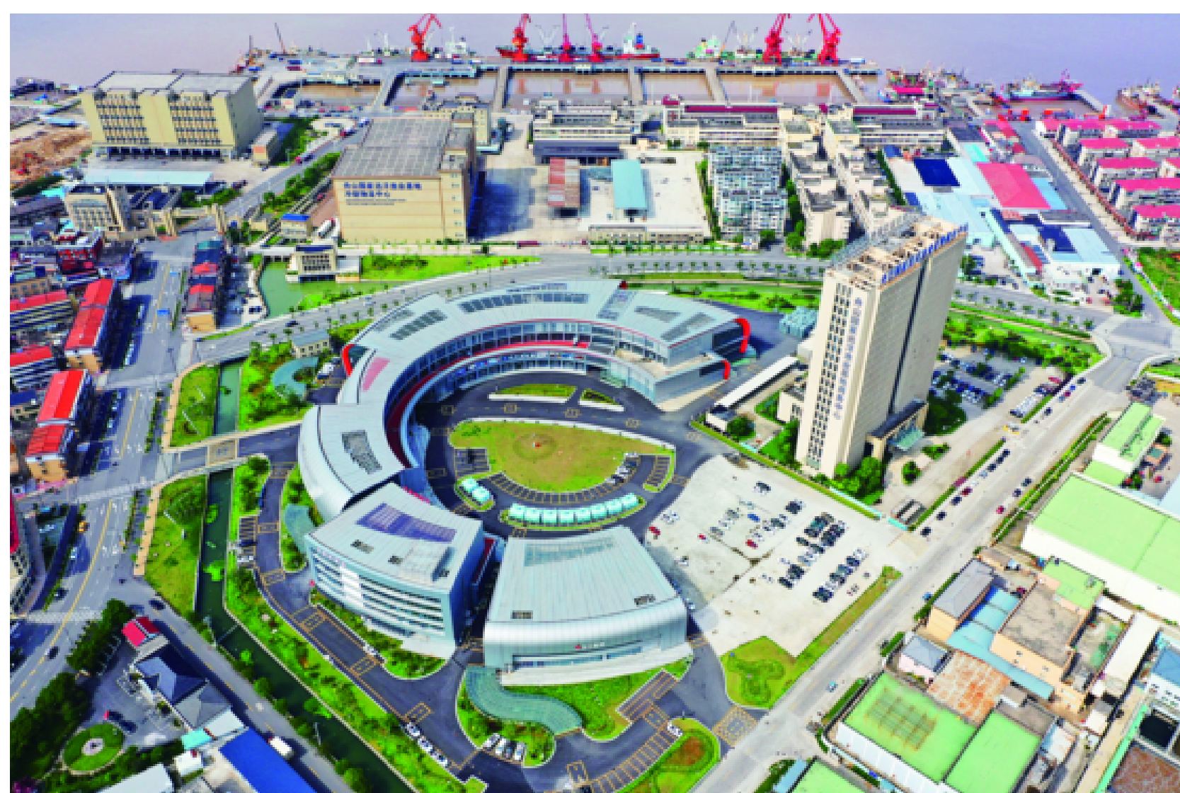
远洋渔业扬帆驶向“深蓝”