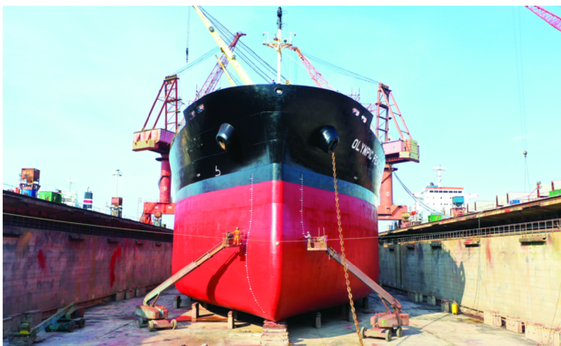
定海工业园区打造高能级产业平台