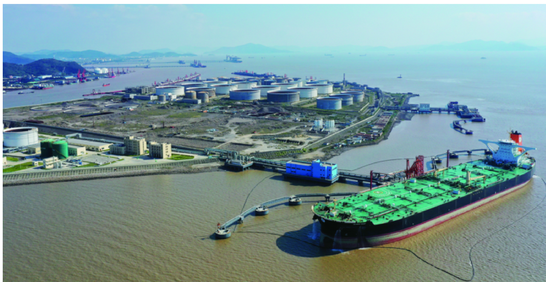
盐田港油气产业链投资项目加快建设