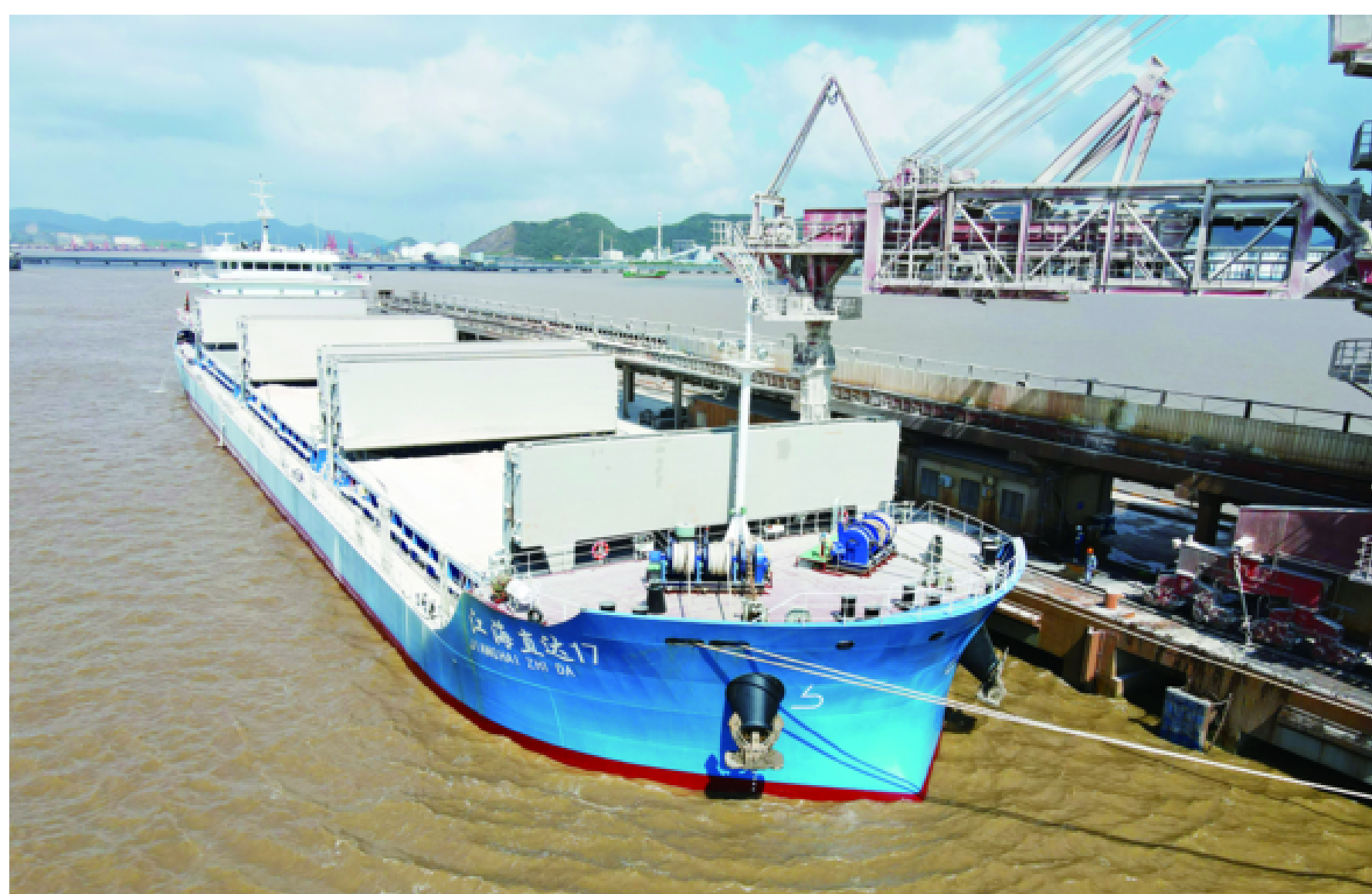
定海江海联运纵深拓展