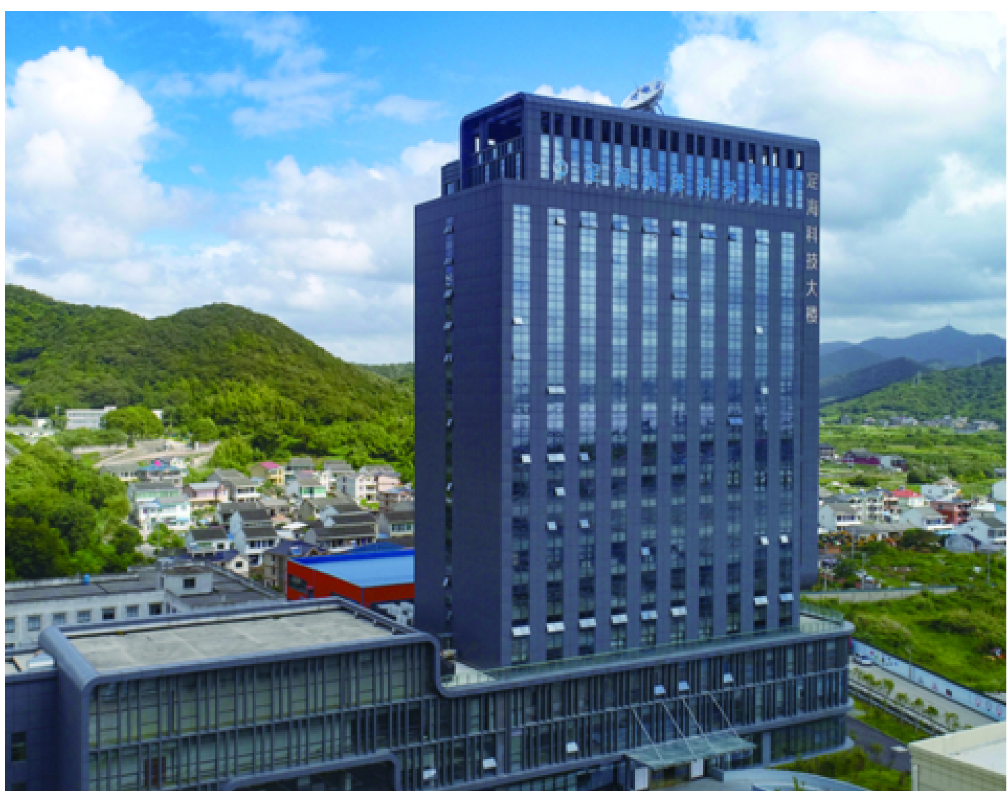
定海海洋科学城列入国家海洋电子信息产业基地