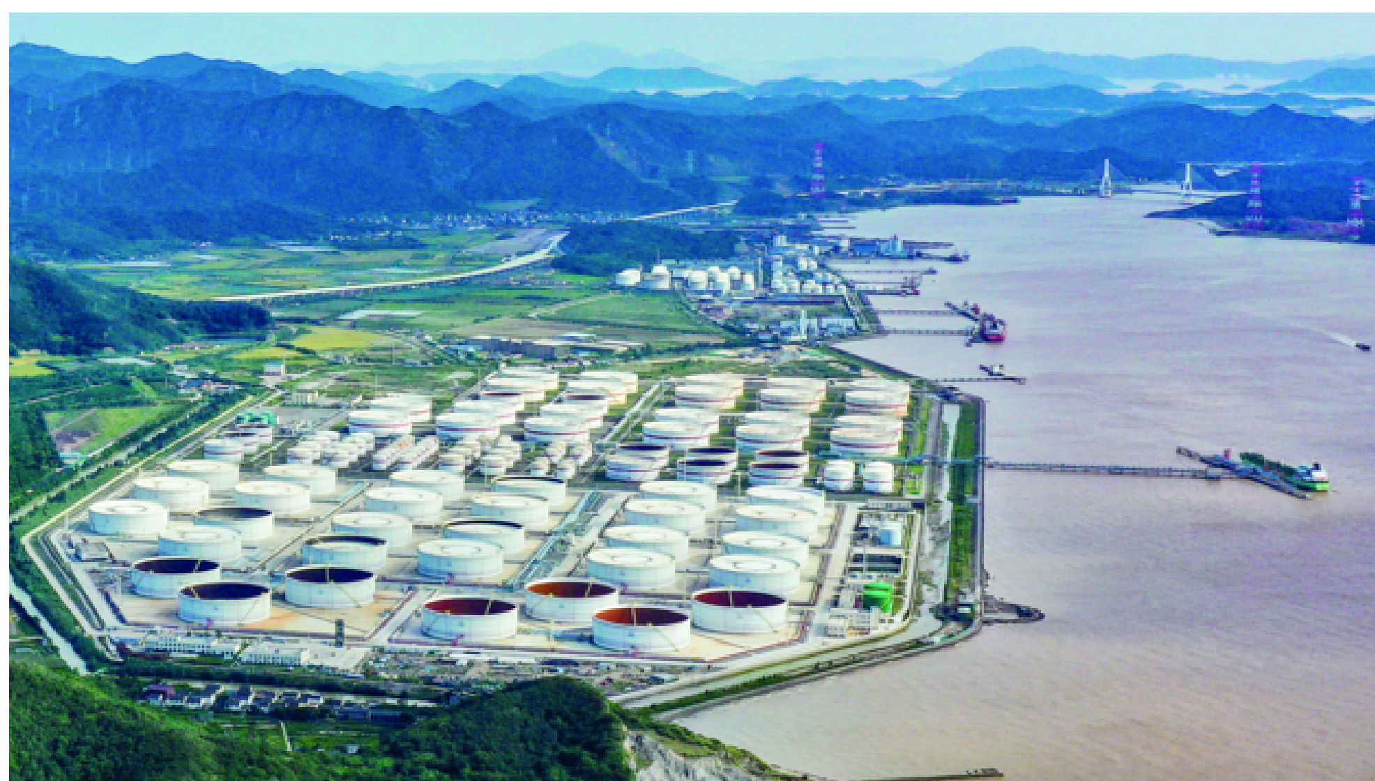
加快建设油气全产业链为核心的自贸区重要功能区